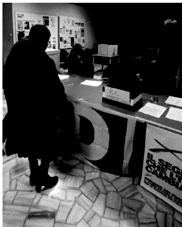
Situazione tranquilla e poche code ai seggi Pd