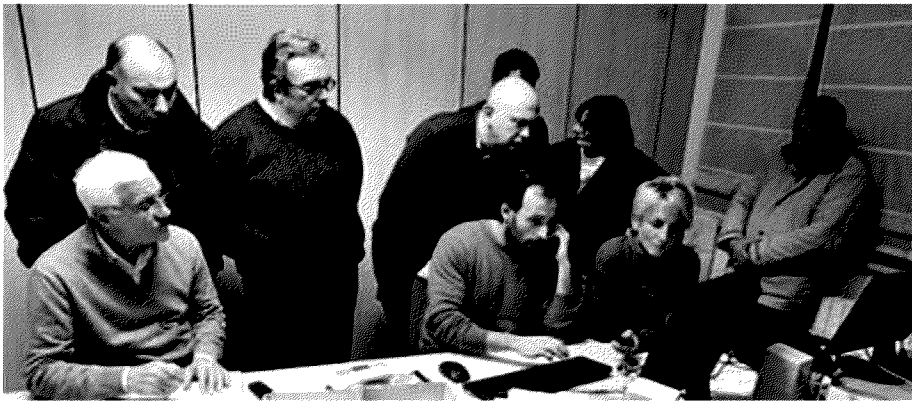
Lo spoglio Militanti del Pd nella sede di via Volturno durante lo spoglio